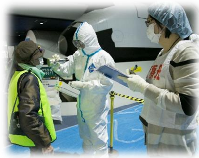
原子力災害医療活動訓練 (避難退域時検査)