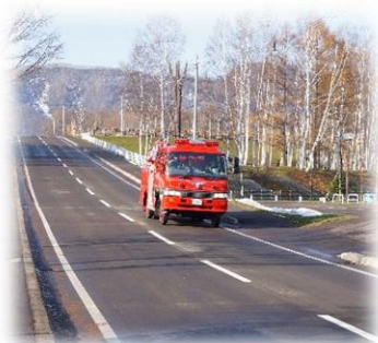
広報訓練 (広報車による広報)