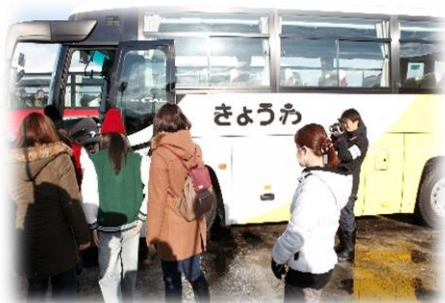
住民避難訓練 (バスによる避難)

※ 2 月 5 日（月）に、防災関係機関によるオフサイトセンター運営訓練などを実施します。